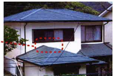
●難しくやっかいと言われる防水の要「壁取合い」