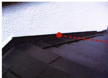
●既存水切りの内側に美しく仕上がった防水処理「壁取合い」