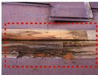
●改修前の腐った部分