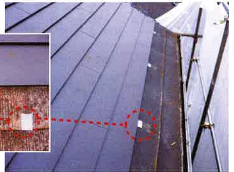
●吊子金具により屋根の傾斜に拘わらずどこからでも工事可能